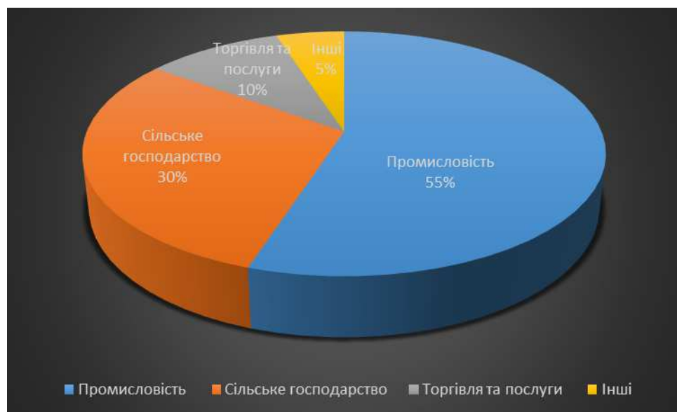
Діаграма 2. Галузева структура підприємств

На теренах громади сконцентровано значний елеваторний потенціал - 176,8 тис.тон одночасного зберігання зерна.