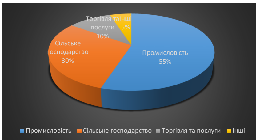
Діаграма 2. Галузева структура підприємств

На теренах громади сконцентровано значний елеваторний потенціал - 176,8 тис.тон одночасного зберігання зерна.