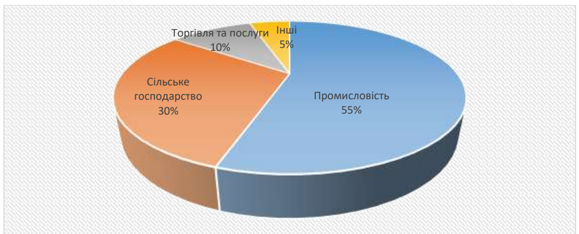
Діаграма 3. Галузева структура підприємств

Слід зазначити, що 65% підприємств розташовані у центрі громади - місті Пирятин.