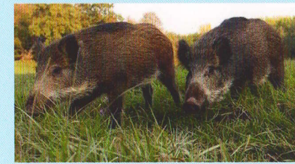
Європейський дикий кабан