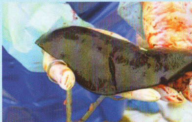
Збільшена в декілька разів селезінка свині при АЧС