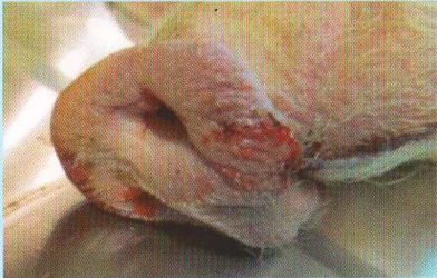
Крововиливи на слизовій п'ятка