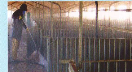
Дезінфекція приміщень де утримувались хворі свині