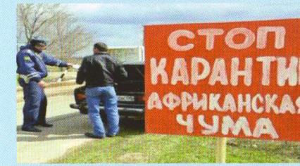
Обмеження на переміщення свиней та м'ясопродуктів в карантинній зоні