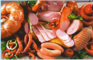
В м'ясних продуктах вірус АЧС зберігається до 6 місяців!